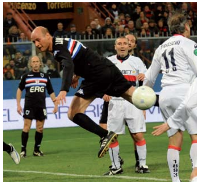
Attilio Lombardo al Delby del Cuore 2009

A mio avviso Palombo e compagni dovranno pensare ad una gara alla volta, solo così si possono ottenere grandi risultati. Le gare contro Atalanta e Siena sulla carta sembrano facili ma nel calcio nulla è scontato: partite che possono essere semplici si rivelano poi più difficili di altre. Gli orobici ad esempio domenica scorsa hanno perso con la Lazio nonostante una buona partita. L'ostacolo più duro sarà quello contro la Fiorentina, che anche se ha perso Felipe Melo è pur sempre una squadra forte e organizzata in ogni reparto.