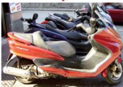
MAJESTY 250 anno 2007 km 23000