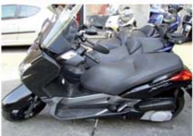
X-MAX 250 anno 2008 km 6700