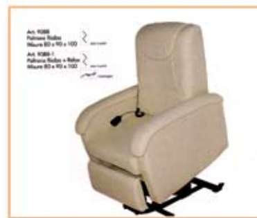
Poltrona alzabile Elettrica € 590,00

Le sorprese non finiscono PER TUTTI I TIFOSI GENOANI... vieni a trovarci!!! Avrai uno SCONTO dal 5% al 10% SU TUTTO!!!