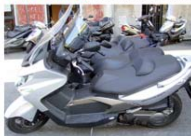
X-MAX 250 anno 2008 km 6700