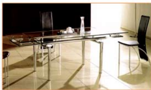
Tavolo in Cristallo "All" + 4 sedie cuoio "RG" € 550,00