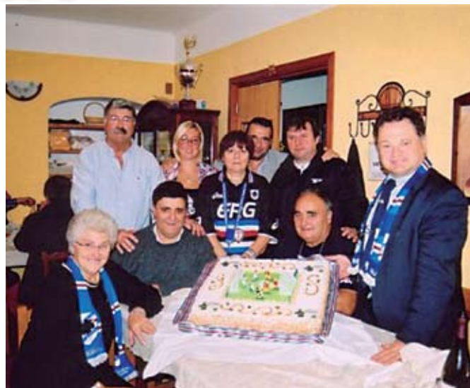
Il Sampdoria club Pegli-Valvarenna in una giornata di festa all'interno del club

Pegli e siamo pronti ad accogliere chiunque voglia far parte del nostro club, uno dei fondatori della Federclubs.