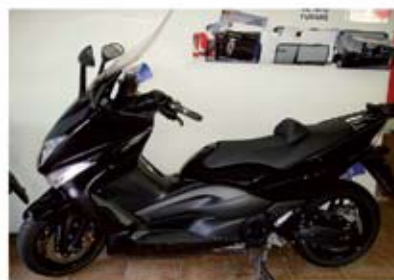
T-MAX 500 anno 2008 km 4000