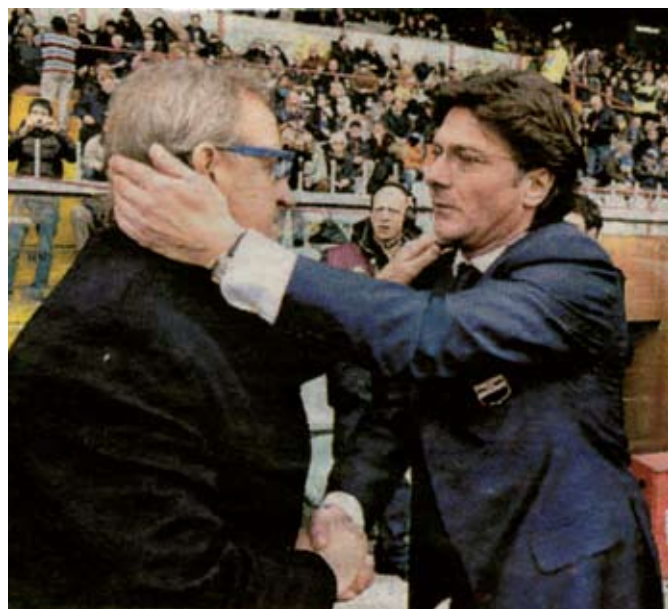
Gigi Del Neri e Walter Mazzarri l'anno scorso a Marassi durante Sampdoria Atalanta.